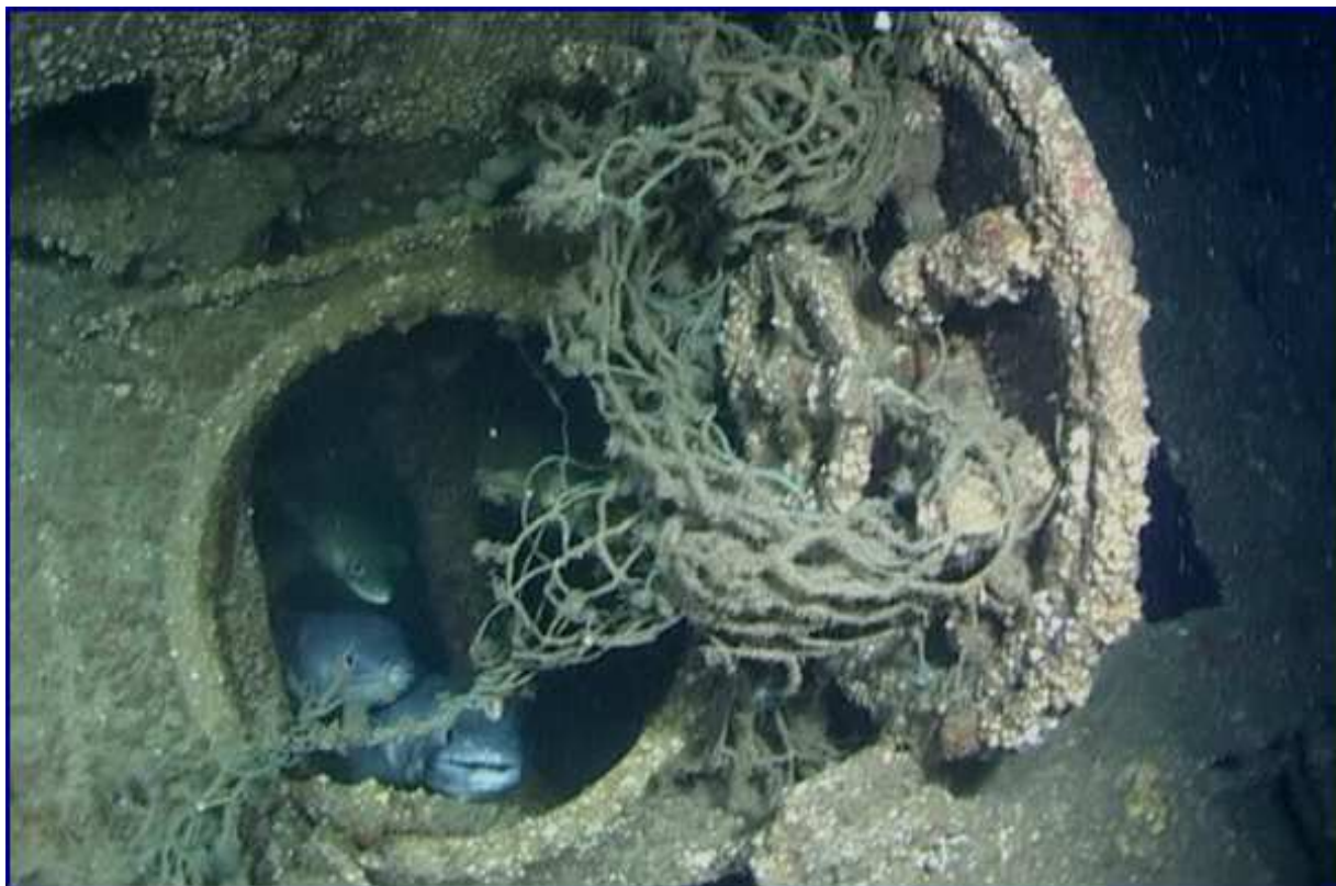
Le panneau de kiosque et quelques membres de son nouvel équipage.