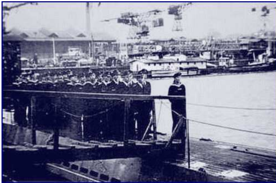
L'équipage ce même jour