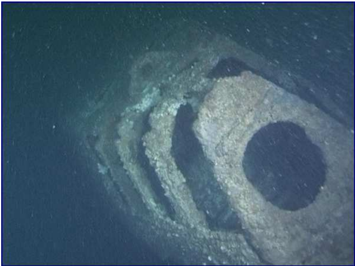
Extrémité arrière de la coque