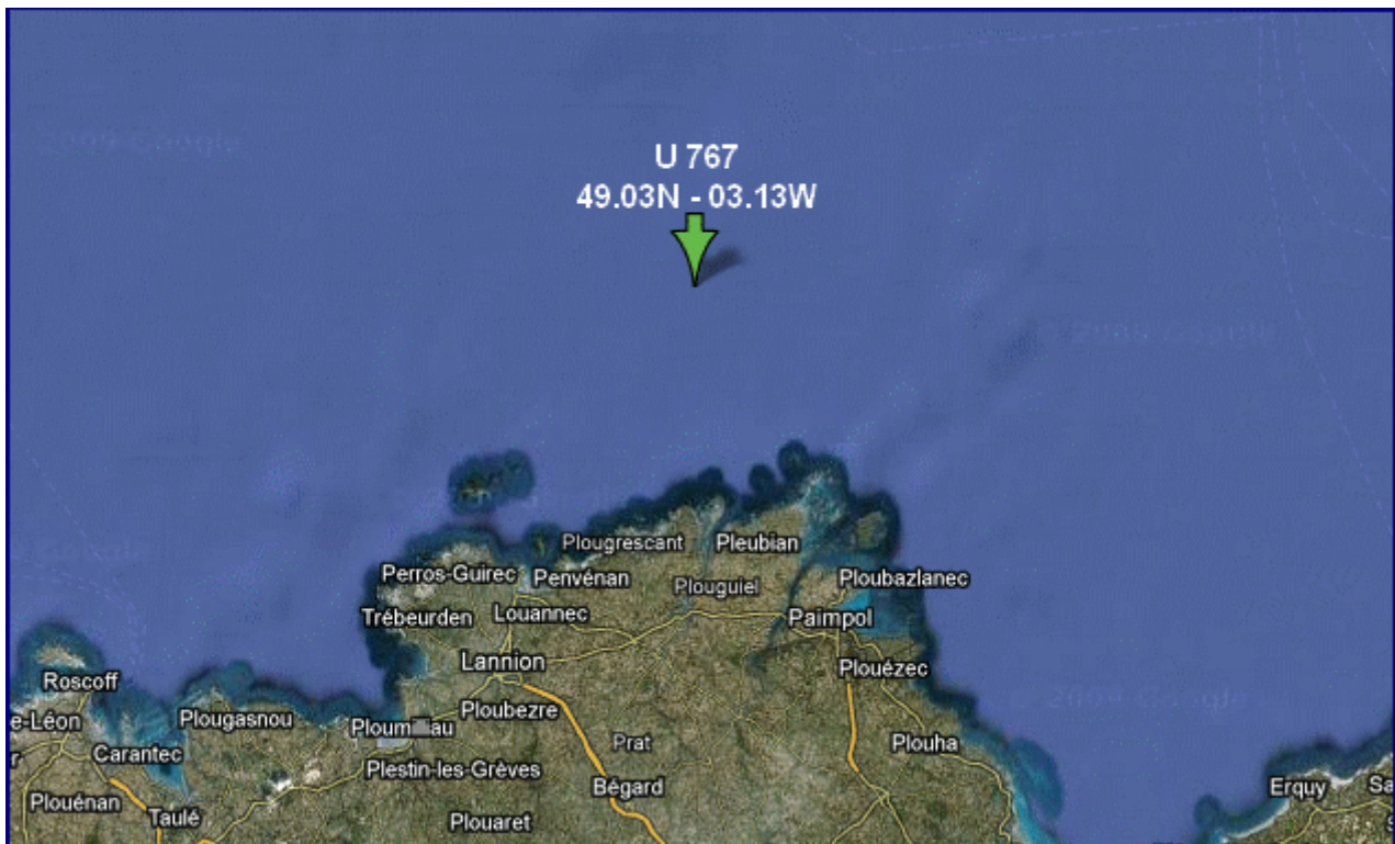
Ici git U 767 avec 48 hommes